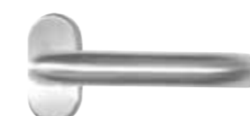
ZIE 2 Innengriff Edelstahl 62,-