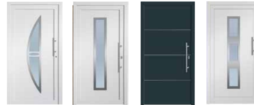
HSF Mailand HSF Paris HSF Dortmund HSF Amsterdam