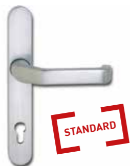
INNENTÜRDRÜCKER AUF LANGSCHILD EUROLINE