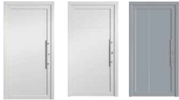
HSF Malacky HSF Madrid HSF Barcelona