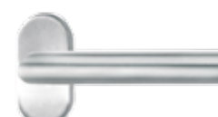
FSB 1076 Innengriff Edelstahl 62,-