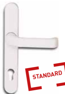
AUSSENTÜRDRÜCKER AUF LANGSCHILD EUROLINE