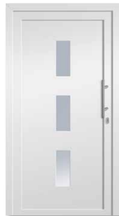
HSF600 Satinato/VSG beidseitig · rahmenlos