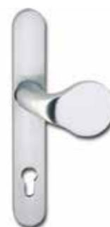
AUSSENTÜRKNOPF AUF LANGSCHILD