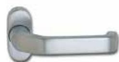
INNEN- UND AUSSENTÜRDRÜCKER AUF ROSETTE