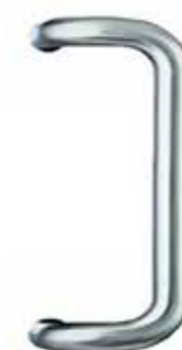
284136 Edelstahl L: 380 mm 227,-