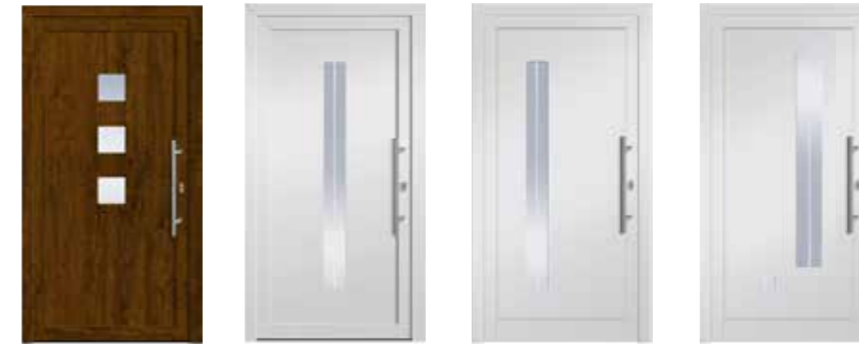
HSF München HSF London HSF London A HSF London B