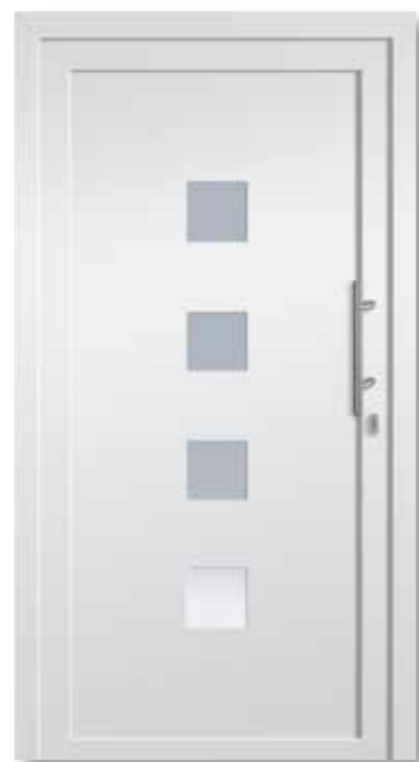
HSF500 Satinato weiß/VSG beidseitig · rahmenlos