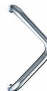
284132 Edelstahl L: 380 mm 227,-