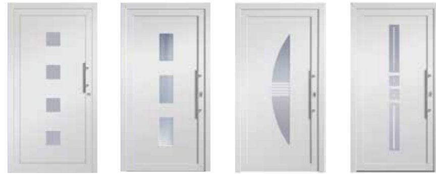
HSF Lissabon HSF Porto HSF Liverpool HSF Rom