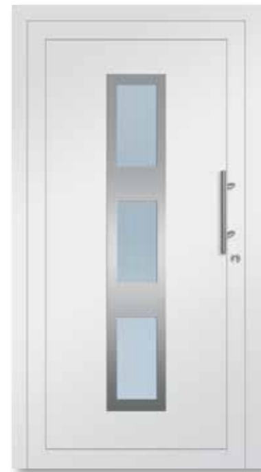
HSF300 Satinato weiß/VSG beidseitig · Rahmen aussen