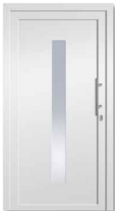
HSF400 Satinato weiß/VSG beidseitig · rahmenlos