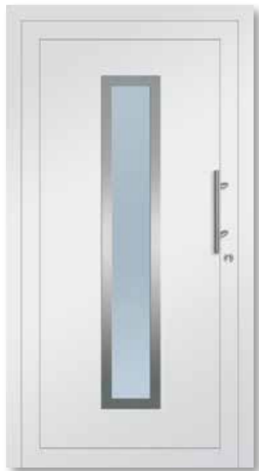
HSF100 Satinato weiß/VSG beidseitig · Rahmen aussen