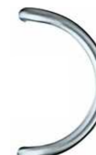
284138 Edelstahl L: 380 mm 268,-