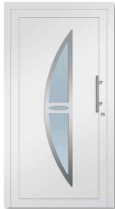
HSF200 Satinato weiß/VSG beidseitig · Rahmen aussen